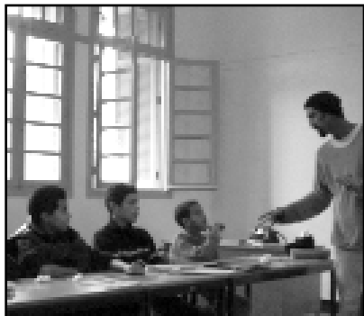
Al Ikram : atelier.

Partageant une préoccupation commune pour le devenir et l'éducation des enfants les plus démunis, l'IKRAM et le CEV ont décidé de prendre appui sur leurs compétences, partenaires et méthodes respectifs pour créer une formation originale dans le domaine des métiers de l'art et de l'artisanat, inscrite dans la perspective d'une intégration professionnelle.