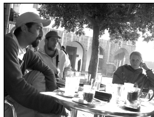
Trois des stagiaires de l'IMF à Casablanca.

1 - Les tendances de la peinture contemporaine marocaine, décembre 2002, PM Editeur