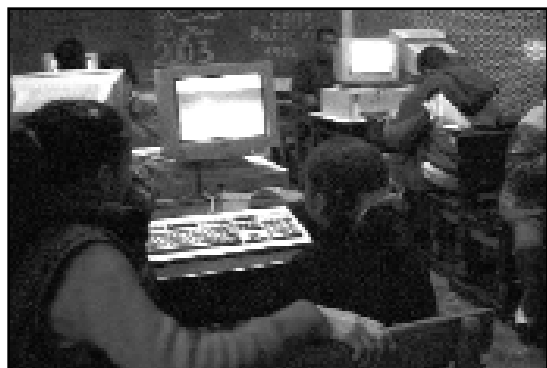
Awassir : les ateliers.

Le rôle du référent professionnel est primordial