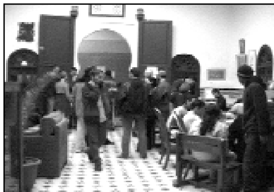
Awassir : les ateliers.

Poursuivant leur formation dans le cadre de cursus extérieurs, certains ex-stagiaires transmettent à leur tour aux plus jeunes à la fois le savoir-faire technique acquis, et l'expérience de responsabilités dans la gestion de l'association, l'un d'entre eux étant actuellement membre du bureau.